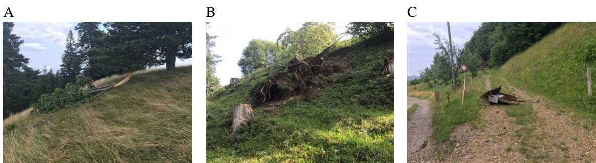
Bild 3. Sturmschäden am 13. Juli 2023: (A) abgerissene Äste, (B) entwurzelter Baum, (C) umgeworfene Informationstafel von Pro Natura.

Ein heftiges Gewitter bewirkte in der Nacht vom 12. zum 13. Juli schwere Schäden (Bild 3). Ein grosser, einzeln stehender Ahorn wurde entwurzelt und musste mit einem Bagger geborgen werden (Bild 3B). Alle Weideflächen mussten in langer Handarbeit vom Flugholz befreit werden, und auch Reparaturen an den Gebäuden und Tafeln waren notwendig (Bild 3C). All dies wurde durch Martin Senn zusätzlich zu seiner normalen Arbeit verrichtet.