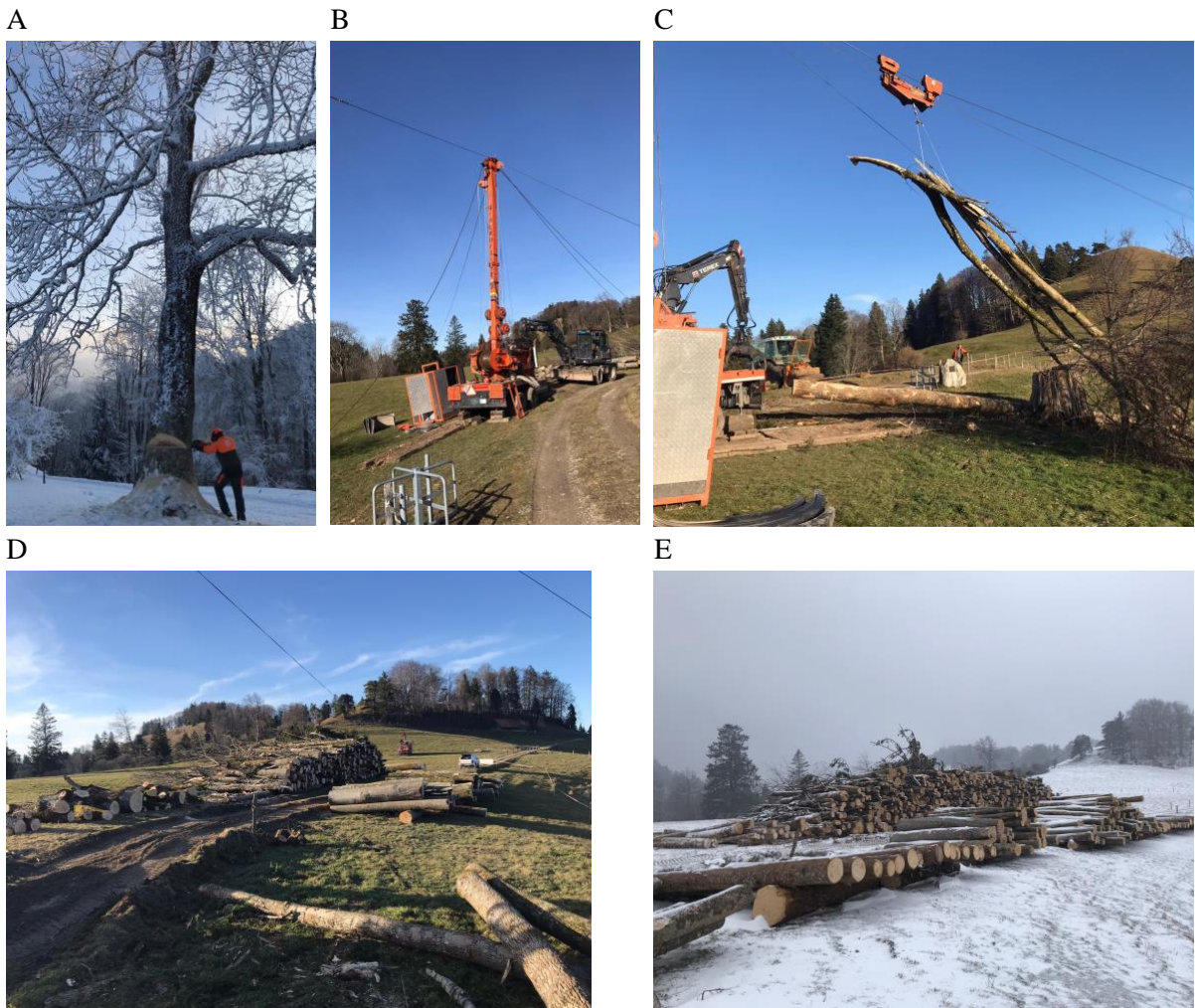
Bild 2. Holzarbeiten im Februar und März 2023. (A) Holzschlag mit der Motorsäge. (B) Aufbau des Seilkran. (C) Transport gefällter Bäume mit dem Seilkran. (D) Holzlager während den Arbeiten. (E) Zum Verkauf sortiertes und sorgfältig ausgelegtes Holz.

Ein heftiges Gewitter bewirkte in der Nacht vom 12. zum 13. Juli schwere Schäden (Bild 3). Ein grosser, einzeln stehender Ahorn wurde entwurzelt und musste mit einem Bagger geborgen werden (Bild 3B). Alle Weideflächen mussten in langer Handarbeit vom Flugholz befreit werden, und auch Reparaturen an den Gebäuden und Tafeln waren notwendig (Bild 3C). All dies wurde durch Martin Senn zusätzlich zu seiner normalen Arbeit verrichtet.